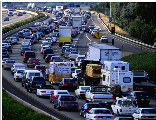
Stauung – Störung im Verkehrsablauf