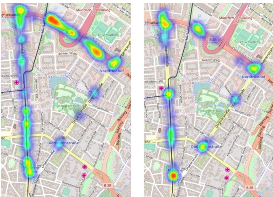
Abb. 3: Heatmaps der Feintypen 631 (links) und 651 (rechts)

Für die Entwicklung automatisierter Systeme sind die Fahrsituationen relevant, die den Unfällen vorausgingen. Hierfür wurden den Feintypen bestimmte Fahrsituationen innerhalb des Testgebiets zugeordnet. Die Zuordnung erfolgte mit Hilfe von Fahrsituation-Aufnahmen, die bei Testfahrten innerhalb des Untersuchungsgebiets entstanden sind, den vorliegenden Kurzsachverhalten und den erstellten Heatmaps. Die Heatmaps ermöglichen es, markante Punkte im Gebiet ausfindig zu machen (vgl. Abb. 3).